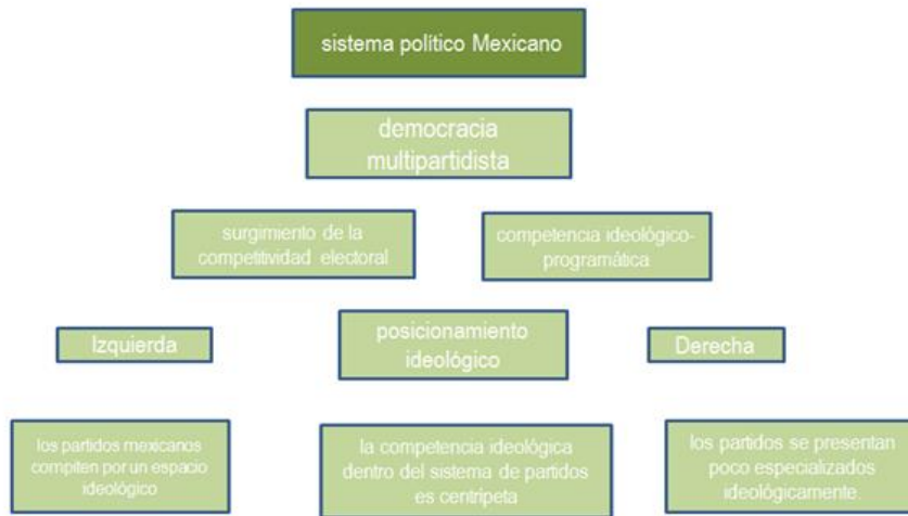
Figura 4. Mapa conceptual. Sistema político mexicano. Elaboración propia